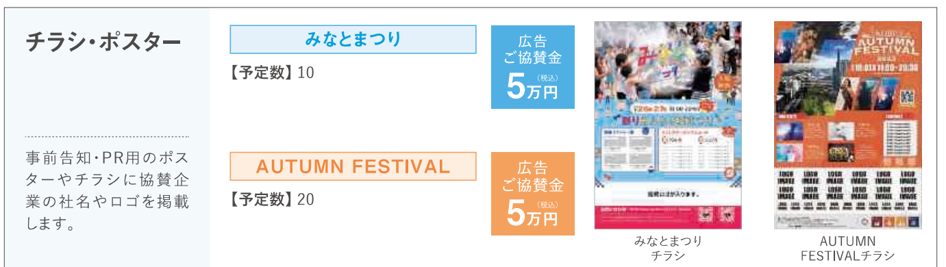
みなとまつり チラシ