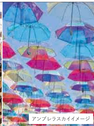
アンブレラスカイイメージ